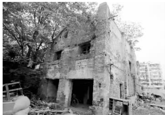
“暗藏”城墙砖的房屋

快报讯(实习生 金悦然 记者 张玉洁) 武定门沿城墙往南走,在城墙西侧有一个物流中心,近日,有市民发现,这里藏着“宝贝”——一栋由城墙砖建造的房子。