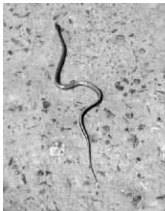
马路上“游荡”的小蛇 网友供图(请来快报领稿费)