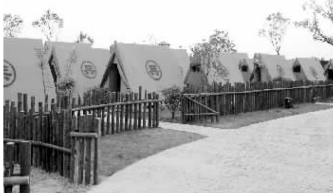
“三国村”内的营帐，6月中下旬开始可接待游客入住