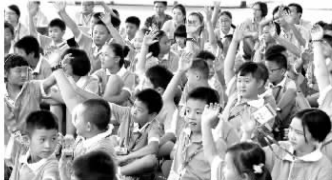
边玩边学,成绩想不好都难!

显,学习成绩在班级都是倒数,在家里,他的学习成绩就是所有矛盾的导火索。真没想到今天的这堂体验课除了让孩子学到学习法,还让我们这些心急如焚的家长见识到错误的教育方式……太感谢了!”