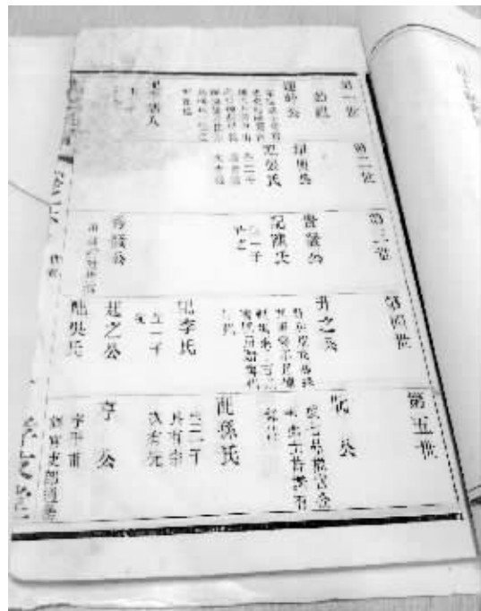
濮存昕和父亲捐赠到溧水档案馆的濮氏家谱