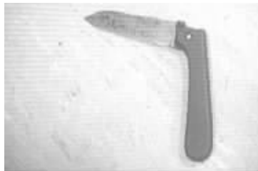
捅向男生的水果刀