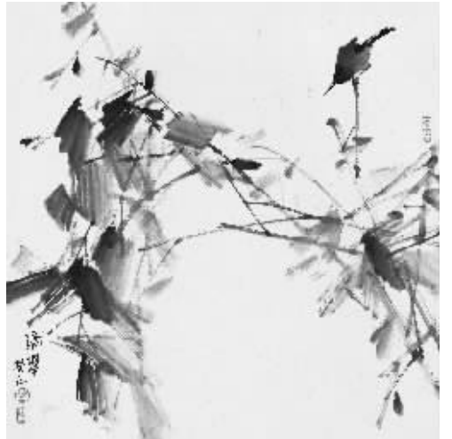
《滴翠》67cm × 67cm水墨纸本