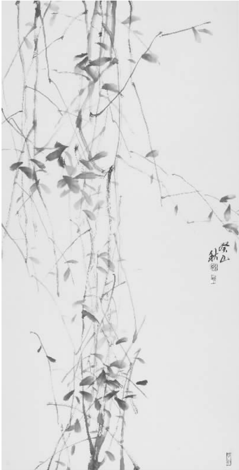
《秋枝》138cm × 70cm设色纸本