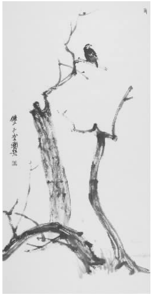
《孤鸟伫立流》70cm × 134cm设色纸本

陈国欢受过系统的学院训练,1980年他毕业于南京艺术学院。虽然学院内有不少教师对传统国画深有造诣,但那时美术教育系统偏于中西融合类型,国画教学也从素描造型入手,兼顾笔墨功力训练。就美术界而言,当时艺术观念仍受泛政治化的影响,对传统文人画体系的认知,还处于有待拨乱反正阶段。可是,陈国欢却对文人画情有独钟,在毕业后的艺术道路上遵循文人画的章法与笔墨进行创作。