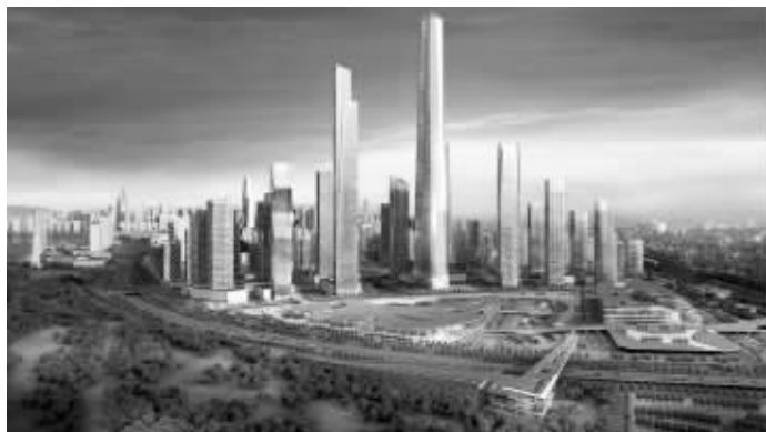
河西鱼嘴地区将建两座大厦,一座高600米,一座500米 效果图

近日,现代快报记者获悉,南京河西南部鱼嘴地区核心区城市设计通过专家评审,该地区将打造成南京的“陆家嘴”,成为河西CBD的旗舰地区。据了解,该地区还规划建设一栋600米超高楼。如果最终实际建设高度为600米的话,其高度将超越紫峰大厦,成为江苏第一高楼,在全国高楼中将仅次于深圳平安国际金融中心、上海中心大厦、武汉绿地国际金融中心,位列全国第四。