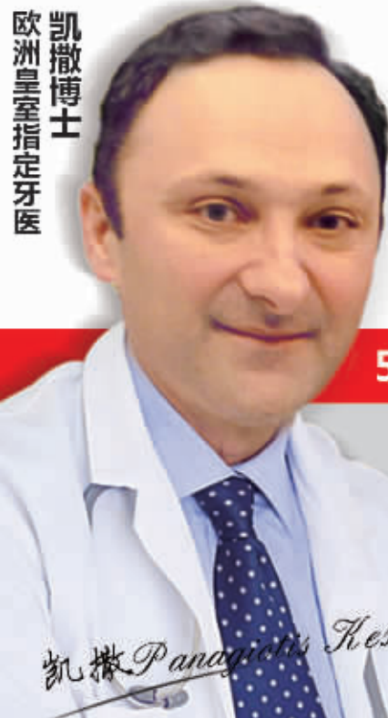
凯撒博士 欧洲皇室指定牙医