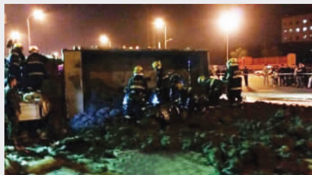
倾泻而出的泥土堆在路面上