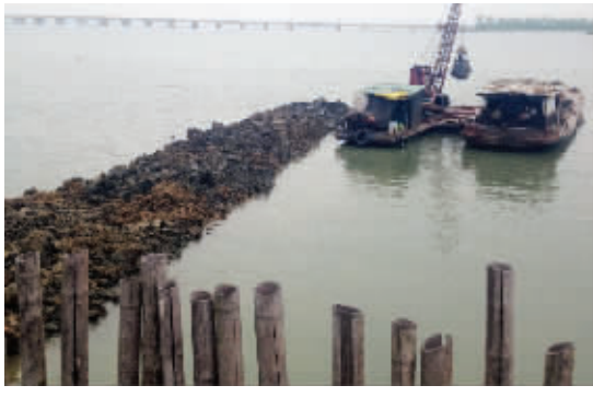
施工人员在湖面进行填土作业