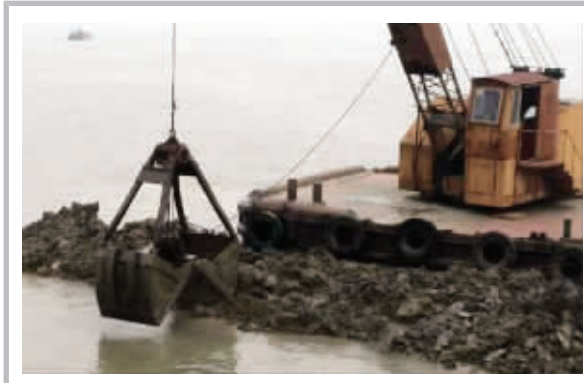
网友拍摄的“填湖”场景

网传当地填埋水面,建设世界联合学院分校 官方回应:学校建设并未占用水面,正在进行的是生态修复工程