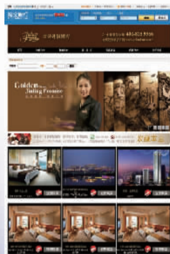
金陵连锁酒店淘宝旗舰店

据最新消息,“淘宝旅行”特别为超过30家金陵连锁酒店在6月12日的“淘宝年中大促”活动中定制了独家版位及多渠道、多维度资源,推广金陵旗下酒店旅游、客房产品,优惠幅度惊人。届时,有需要的客人可访问淘宝网金陵连锁酒店旗舰店(jinlinghotels.tmall.com)。