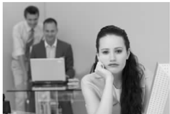
老板没下班,很多员工就不好意思先走