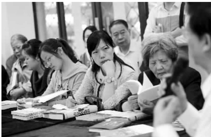
爱书人士相互推荐交流,分享各自阅读感悟