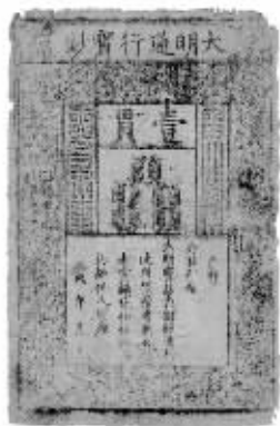
大英博物馆藏明代纸币

中国自古以来就和世界各国有着密切的文化交流,随着正常的文化交流,中国的艺术品被带往世界各地。但自晚清第一次鸦片战争后,战争、盗窃、走私等多种非正常途径,导致中国众多珍贵文物开始大量地流失到海外。例如,敦煌藏经洞约5万种各类文物至今分散在十几个国家,由此还产生了闻名世界的显学“敦煌学”。而在清末的文物外流过程中,作为老牌资本主义国家的英国,得到的中国文物在数量和质量上都居于前列。