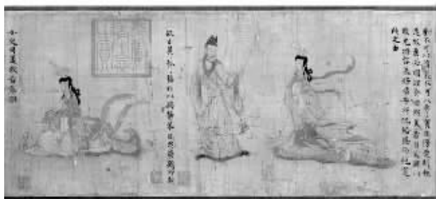
大英博物馆藏《女史箴图》

除了假币,朱元璋还面临着纸币贬值的挑战。明朝的纸币分为一贯、五百文、四百文、三百文、二百文、一百文六种。大英博物馆收藏的这枚明代纸币,面额显示为一贯,纸币上画有十串铜钱(十串铜钱为一贯)。当时一贯的纸币可以兑换一千文铜钱,可以兑换一两银子。四贯的纸币可以兑换一两黄金。如果纸币因使用时间久而破损了,持有人可以拿着破损的纸币到政府设置的有关部门去兑换新纸币。当然兑换的时候,会象征性地收取一点手续费。纸币和金属货币之间可以公平兑换,这本是好事。然而,随着大明王朝无节制地印刷纸币,纸币开始贬值,在发行宝钞十五年后,就有记录显示,一张面值为一贯的宝钞就只能兑换二百五十文铜钱。也就是说,纸币的实际使用价值只有币面价值的四分之一了。