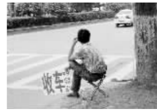
代检黄牛生意清淡

南京市车管所相关人士说, 目前机动车检测已经全部实行社会化服务, 车管所不收取任何费用。车管所在检测线各个环节安装监控探头, 拍摄图片和视频。“但也有个别站点存在人为弄虚作假, 暗地弄手脚。”这位负责人说, 去年, 南京就有4家检测站, 因为违规操作, 车管所联合质监部门, 禁止对他们核发检验合格标志。