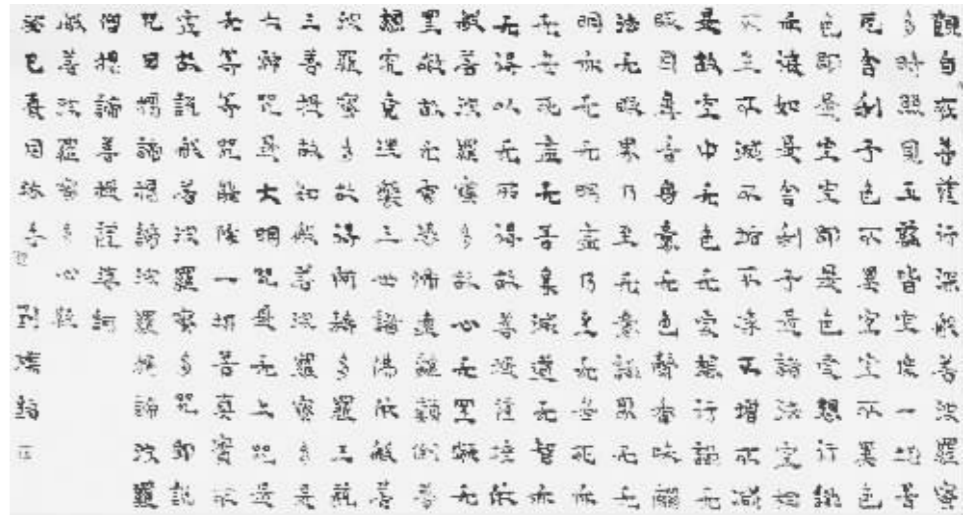
刘灿铭《般若波罗蜜多心经》