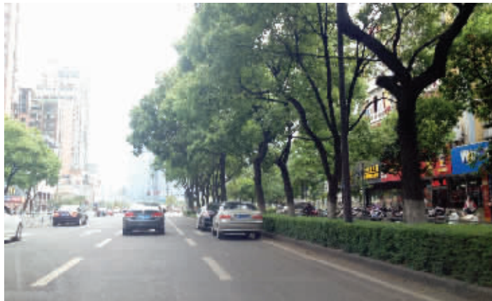
即将严管的清扬北路,路边还有不少违停车辆