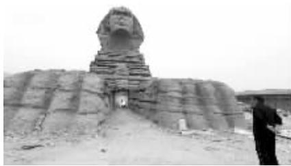
正面以及两侧面有小门可以进去