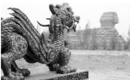
不远处有一个中国传统的龙形雕塑