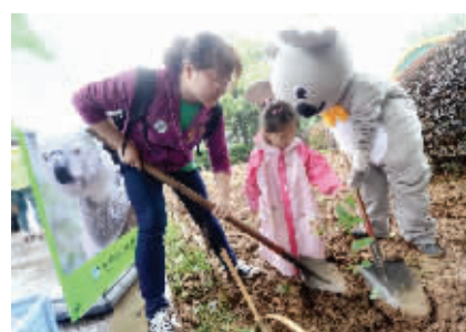
我为考拉“桉”个家

由于一株桉树苗长到可供食用,需要一年的时间,因此如果考拉到达初期,这些桉树无法保障考拉食源的供应,动物园也制定了从澳洲空运桉树叶的预案。