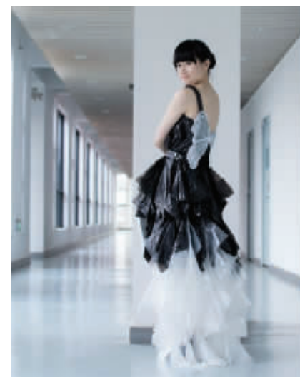
用垃圾袋做的“红毯礼服”

由于塑料袋不结实,穿着也要非常小心,好在,最后呈现的效果很不错。两个女孩开心地表示:“其实美丽不是用很豪华很奢