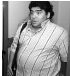
肥胖时的马拉多纳

自1997年球王马拉多纳退出职业足坛后,短短几年,他的体重以火箭腾空般的速度飙升,俨然成了个“肉球”——1.68米的身高,体重120多公斤。马拉多纳不愿就此“沉沦”,为了恢复体形,2005年,马拉多纳接受了“胃绕道手术”。2008年北京奥运会,媒体报道称,“马拉多纳神清气爽再督战,身形暴瘦年轻数岁。”可见切胃瘦身效果不错。