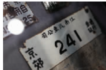
江南汽车公司车牌