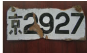
1940年代,南京号牌一度变成了四位数