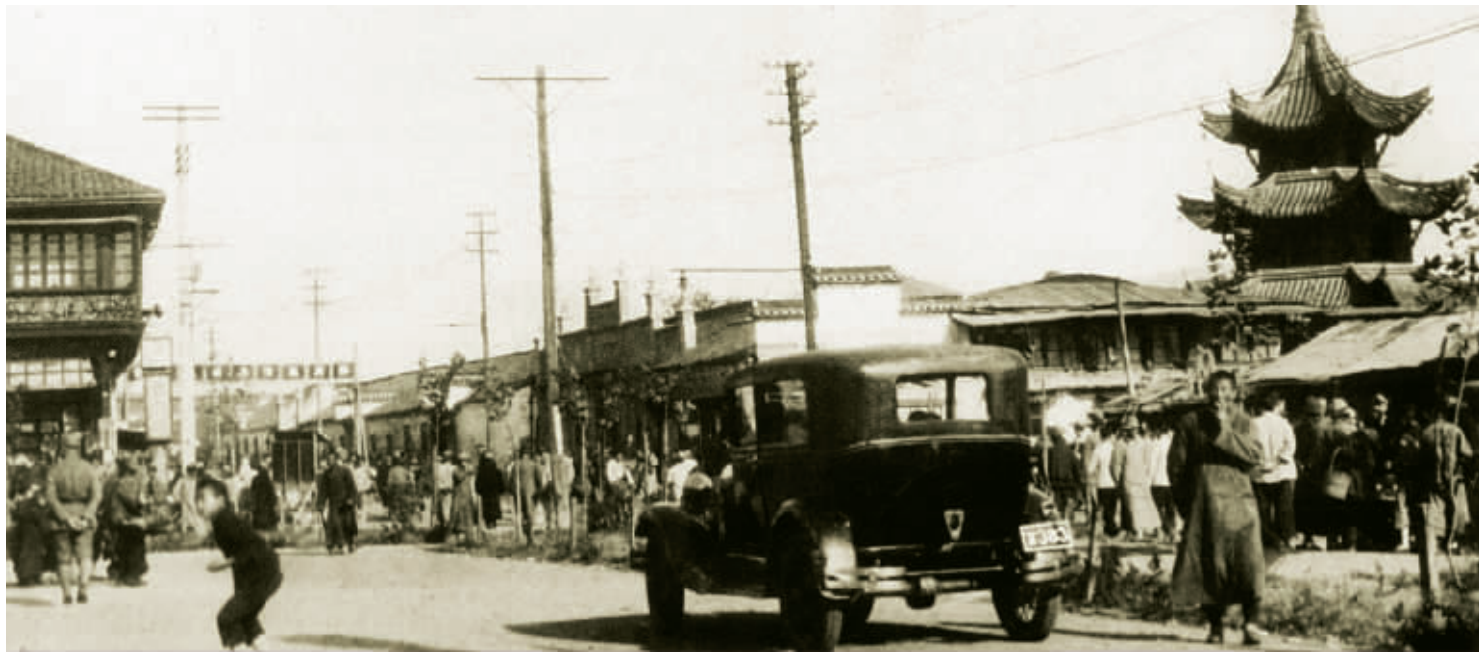
20世纪30年代的夫子庙街景,一辆车牌为“京383”的汽车在行驶