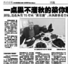
现代快报当时的报道