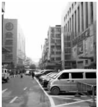
施划了停车泊位后,网巾市的停车秩序好转

这段时间以来,南京在一些支路街巷施划了5000多个临时停车位,以规范停车秩序。不过,这种便民措施也引发了争议。骑车人认为自己的路权被侵占。交通规划专家认为,在主城区开辟大量停车位,与绿色交通理念相悖(详见昨天现代快报B1版)。昨天,江苏省公安厅常务副厅长陈逸中在做客中国江苏网在线访谈也表示,公安交警部门是在确保不影响正常通行的情况下予以施划。市民如有异议,可联系当地交警部门,由交警部门实地察看对确有影响的停车位进行调整。 现代快报记者 朱俊俊