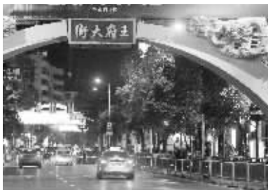
王府大街上的灯光拱门依旧五彩斑斓

位于新街口的王府大街,也是不少市民常去的商业街。5月5日晚9点,记者从汉中路刚拐进王府大街,就能看到一拱门,一路往南走,隔一段就有一个灯光拱门,闪烁着五彩斑斓的灯光,看上去很热闹。