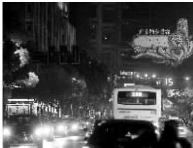
夜晚的湖南路,这块大招牌没有亮灯

其提到灯光景观,南京人首先想到的是湖南路。湖南路曾经有座灯桥,上写有“全国百城万店无假货示范街”,夜晚灯光闪烁,远近闻名。不过时间长了,灯桥已有不少损坏,去年亚青会之前,这个灯桥就被拆除了。