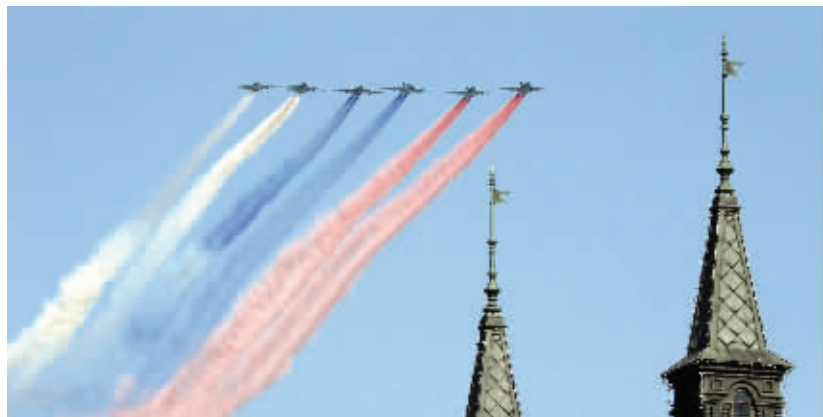
战机飞过阅兵式上空