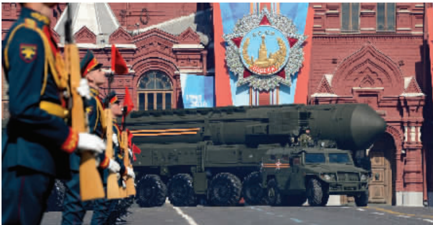
装有“白杨-M”导弹的车辆经过红场

随后,俄罗斯陆军、空军、海军、战略导弹部队等陆续通过观礼台。约1.1万名官兵、200多套军事装备、69架飞机接受检阅。