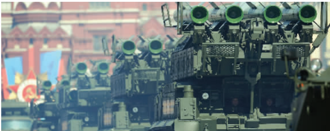
“山毛榉M-2”方阵接受检阅

空中编队的69架飞机象征今年是卫国战争胜利69周年,俄军出动了全部家底。其中,米-35武装直升机和雅克-130教练机是首次亮相。