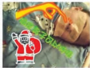
孩子被老师用胶带遮住嘴和眼睛

鉴于签订的劳动合同书中有约定“违反工作规定或者操作规程,发生责任事故,或者失职、渎职,造成