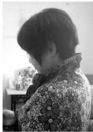
甄女士考虑告丈夫重婚