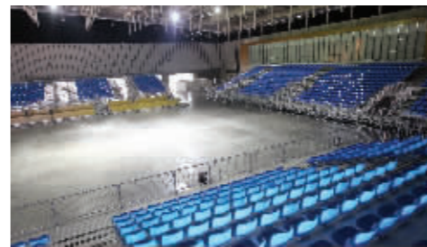
举重馆新添临时可回收座椅

此前到南京国际博览中心都是看展会,在青奥会期间,到这里的D馆、E馆、F馆来看重量级的比赛吧。三个馆在3月中下旬才交付会展公司。此前非常火爆的《最强的大脑》就是在F馆现场录制的,栏目组3月20日才撤离,230名施工人员加班加点,花了20天左右,将这里变成举重馆。