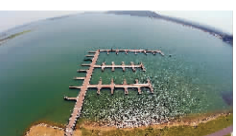
风景宜人的金牛湖

青奥期间,“百舸争流、千帆竞渡”的场景将在金牛湖风景区上演。作为青奥会帆船比赛(兼训练)场地,这里届时将有大约100名运动员展开角逐。远远望去,整个比赛场地“隐于山水之间”,与周围的湖光山色融为一体。据介绍,目前建筑面积14000平方米的赛事综合楼已正式投入使用。其中,为配合帆船赛事需要,塔楼上安装了高清探头,还规划了全景摄像机位。综合楼的其余部分则分为赛事指挥中心、运动员中心、媒体及行政中心和运动员更衣淋浴区等,其相关附属设施全部“接轨”青奥标准。比赛期间的70个船艇泊位码头、下水坡道等主要设施目前已全部建成。青奥会后,这里将作为南京奥林匹克帆船中心,承接一系列国际大型比赛。