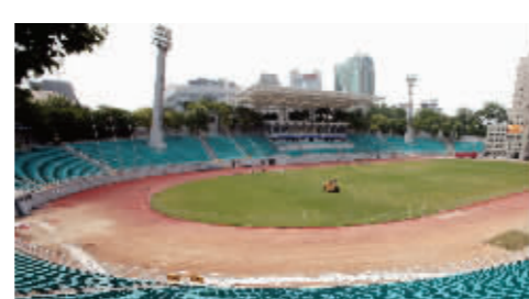
五台山体育中心增加了不少看台座位

五台山体育中心曾举办第二届亚青会的乒乓球、足球、篮球比赛。记者来到承接青奥会足球比赛的体育场,据工作人员介绍,看台座位数已从18000个增加到22000个。