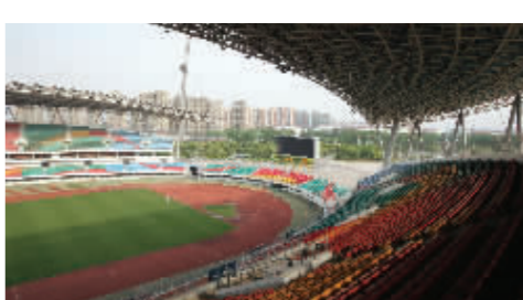
绿茵场草皮正在进行养护

江宁体育中心体育场位于方山脚下,青奥期间,来自6个国家的足球小将们将在这里角逐青奥男足冠军。