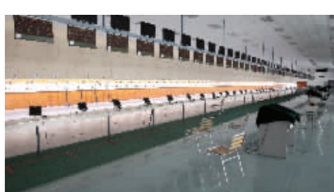
赛场可容纳70名选手同时比赛

江苏省方山体育训练基地座落在江宁方山脚下,射击场馆此前曾举办过亚青会比赛,此次只进行修缮和设施增补。赛场采用了世界一流的瑞士休斯电子靶,可以容纳70名选手同时比赛。一楼的决赛场地特意增加了观众席,届时可容纳300多人。