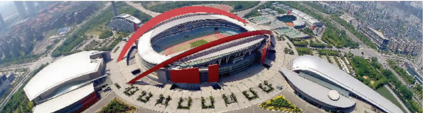
青奥会主会场——南京奥体中心

青奥会有哪些场馆,都分布在哪里?据悉,南京青奥会共有35个场馆,其中27个是竞赛场馆,8个是非竞赛场馆,绝大多数是改造利用现有的场馆,坚持能改不建、能修不换、能租不买、能借不租的原则,节俭办赛。近日,现代快报记者探访了青奥会场馆,了解了场馆改造、准备的最新进展以及赛后的利用计划。感兴趣的市民,快来看,你家门口有没有比赛场馆吧。