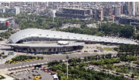
南京奥体中心游泳馆

作为青奥会的主会场,南京奥体中心无疑是任务最重的场馆,除了举办开闭幕式外,主媒体中心也设在这里,并承担四大项比赛。不过,奥体中心曾是十运会和第二届亚洲青年运动会的主会场,可谓身经百战,像体育馆、体育场、游泳馆除了维护出新外,基本没有大的改造。这里共将产生300多块奖牌,其中金牌达120多块,数量最多。而在比赛项目中,田径项目中的8×100米接力赛将移至青奥村北门外的燕山路举行,增设500个临时看台座,很有看点。