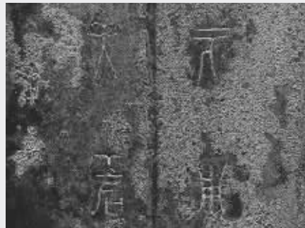
吴王夫差剑铭文, 全文应为“攻敌(吴)王夫差自乍(作)其元用”