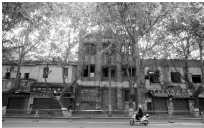
太平南路上的浙江庆和昌记支店旧址