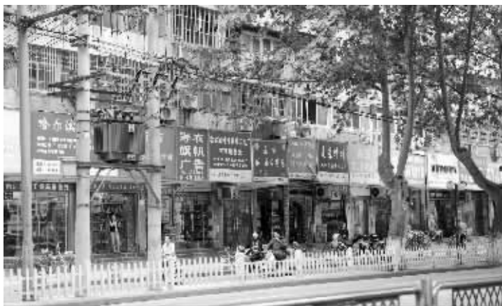
现在的太平南路显得有些破落