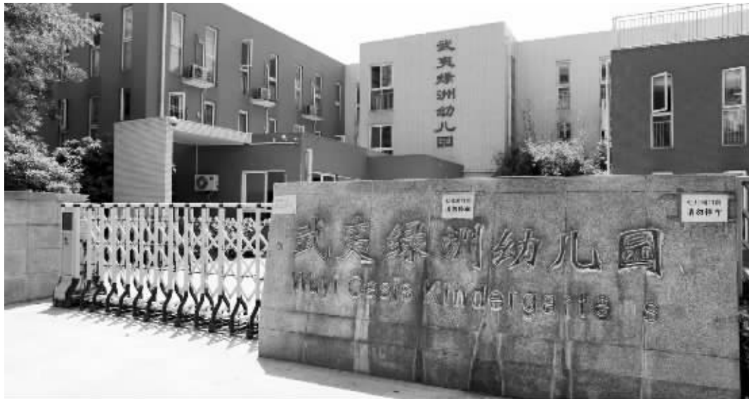
菲菲所在的武夷绿洲幼儿园

“这种事情就发生在我身边,太让人震惊了。孩子这么小就受到了伤害,家长怎么受得了!这种事一定要调查清楚,给孩子和家长一个交代!”这名网友气愤地说。