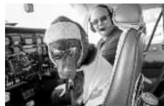
卡利和主人一起乘飞机

据英国《每日邮报》5月5日报道,英国拉布拉多犬卡利随主人乘坐飞机飞遍英国上空,飞行时间超过250小时,总航程8万公里。英国航空器拥有者及驾驶员协会(AOPA)为卡利颁发了“机组人员卡”,这意味着卡利可以在机场使用“机组人员通道”。