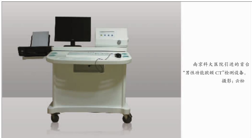
南京科大医院引进的首台 “男性功能欧姆 CT”检测设备。

据南京科大医院特聘上海专家、国务院特殊津贴专家曹承华教授介绍，现代社会不少男人在夫妻生活中，不能控制自己结束夫妻生活的时间，草草了事，无法让女方感到满足。现代医学认为，男性夫妻生活时间在2-6分钟属于正常范围，而时间不到2分钟者，可视为男性功能障碍，即“2分钟先生”。据调查显示：在中国25岁以上的男性群体中，52%以上会不时或长期承受男性性障的痛楚。过去认为心理因素、环境因素是造成男性功能障碍的主要原因，因此多采用心理行为疗法，如改变生活习惯、调整体位等，这种疗法对部分患者曾有一定的作用，但很多人最终还是无法真正解决问题。