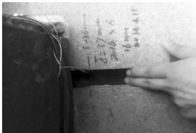
台阶与房屋接缝处的最大裂缝可以伸进去两根手指

吴中国香雅苑小区的居民日前致电现代快报热线说,从去年10月份起,该小区的1幢和2幢两幢楼的内外墙及地面因为轨交2号线延伸线的施工而出现裂缝。如今,裂缝还在不断扩大,他们多次与承建单位中铁十一局沟通,都没有结果。记者多次联系项目相关负责人,但对方没有回应。蒋文龙 文/摄