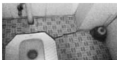
底楼一处店面的卫生间裂开了一条长缝