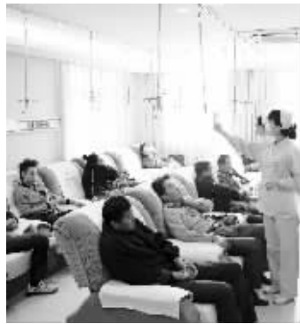
南京建国男科医院输液大厅爆满,护士仔细观察患者输液情况。