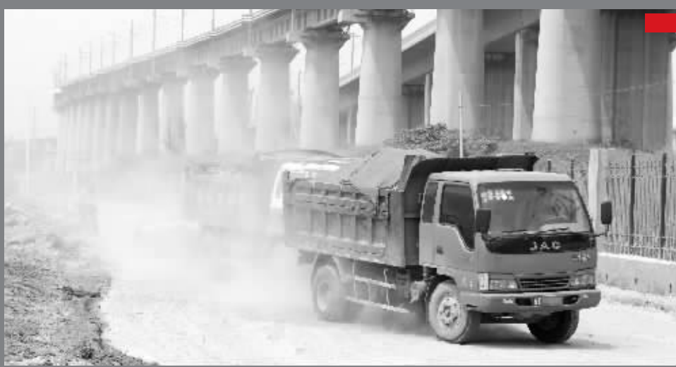
双麒路上,倾倒垃圾的车辆驶过,扬尘弥漫