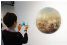
“依然香如故”展览现场