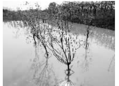
种下的苗木也被水淹了