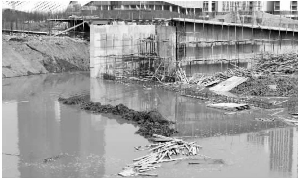
园林经济开发公司的工地现在变成了一片池塘