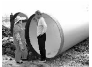
南京市水务集团将新管道运到现场