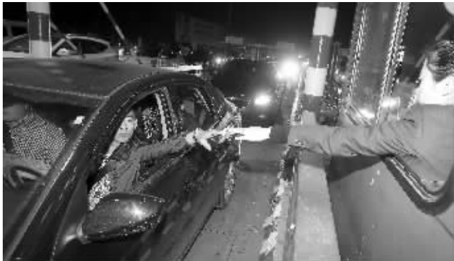
今天零点,首辆免费通过收费站的小车

23点50分,大部分车辆都等候在出站口附近。收费站的工作人员与车主沟通,希望他们提前准备好通行卡。这位工作人员告诉记者,沪宁高速南京收费站出口开放了8个通道免费放行。