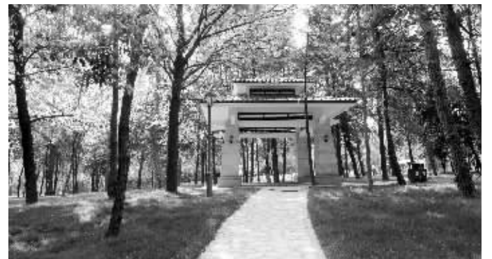
中山陵广场的凉亭

快报讯(通讯员 高炜 记者 余乐)“五一”在南京中山陵玩累了,可以到陵寝南侧的中山陵南广场歇歇脚。