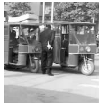
案发现场