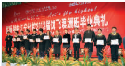
优飞学生团队获得2013年美国紫色彗星数学联赛中国赛区第一名。图为毕业典礼上为此项目颁奖。