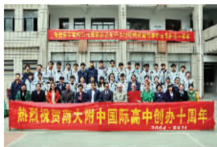
国际高中成立十周年部分师生合影