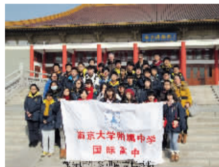
学生在南京博物馆学习

中加班是与加拿大多伦多CTC国际学校联合举办,学生可同时获得两国高中毕业证书。七届毕业生全部成功申请国外大学,其中不乏国际名牌大学,如世界排名18位的加拿大多伦多大学、美国常青藤名校之一的宾夕法尼亚大学,格林纳尔学院和明尼苏达大学,拥有“加拿大的哈佛”美誉的英属哥伦比亚大学、加拿大麦克马斯特大学(加拿大排名第9位)、渥太华大学、温莎大学、川特大学,美国的马歇尔大学,澳大利亚的莫纳什大学(澳大利亚大学排名第3位)等。