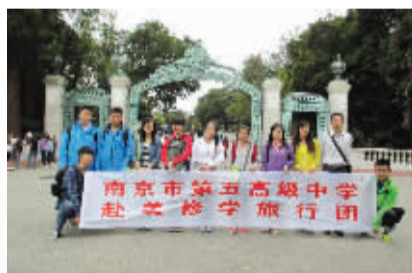
赴美修学旅行团加州大学伯克利分校之行