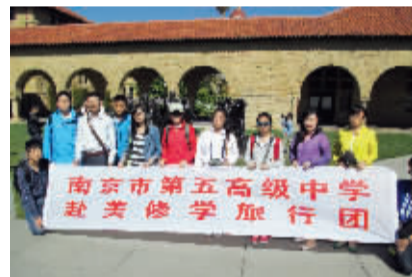
赴美修学旅行团斯坦福大学之行