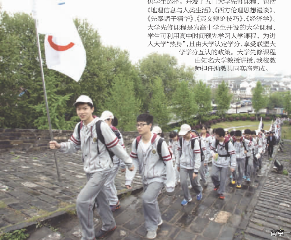
南京一中2014年“迎青奥 祝申遗”慈善行走活动