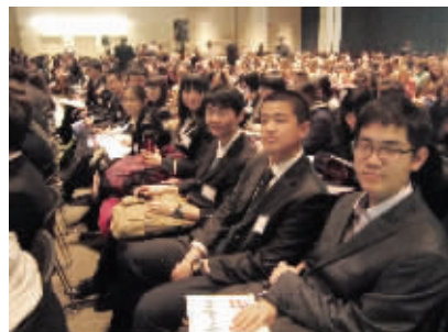
模联社参加哈佛大学第61届模拟联合国大会

学生社团作为第一课堂的补充和延伸,在丰富学生课余生活、提高学生综合素质、引导学生适应社会、促进学生成人成才等方面发挥了积极作用。