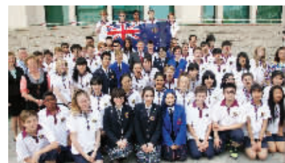
高一AP班学生与澳大利亚维多利亚州州长丹尼斯在一起

一中AP班是我省唯一一所由本校独立承办的国际课程班(没有中介),管理团队强大,师资力量雄厚,着眼于学生终生发展,根据学生的兴趣、爱好和特长,申请以美国为主的世界一流大学。任教AP班的所有数、理、化、生以及英语教师均为本校在职骨干教师,既有高考经验,又赴美参加美国高中课程培训,并研修AP课程教学,均获得AP教师资格证书。在AP班任教的外籍教师来自美国和英国,师资队伍稳定,均有教师资格证书和外国专家证。外教专业知识精良,具有丰富的教学经验,受到学生和家的一致好评。