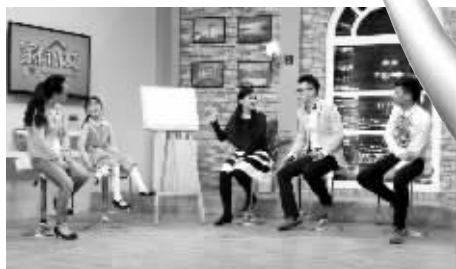
《家有儿女》节目现场