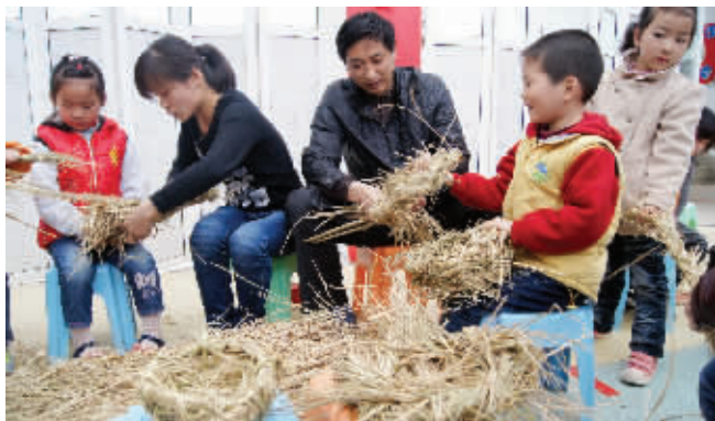
幼儿和家长们一起编鸟窝