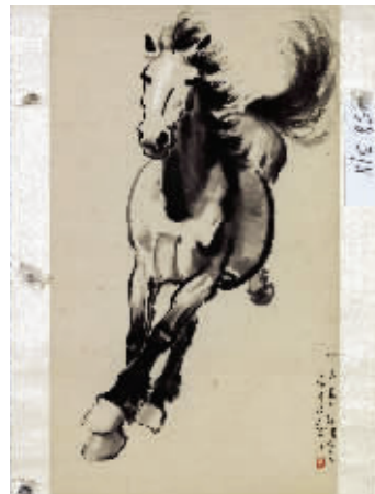
首批展品中徐悲鸿的《奔马图轴》(苏州博物馆供图),右为布展现场 王玲玲 摄

这次画展中所有展品将以1950年为界分为上下两期进行展出,上期展出时间为:4月25日-6月8日;下期展出时间为:2014年6月12日-7月20日。 王玲玲 文/摄