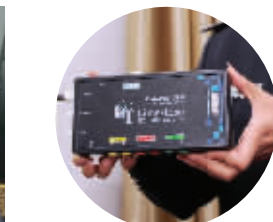
左图:警方现场对记者测谎 上图:测谎仪的“大脑”身价30万