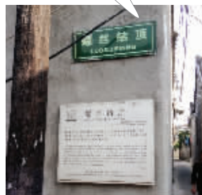
墙上挂的是扬州文物局对巷名的介绍