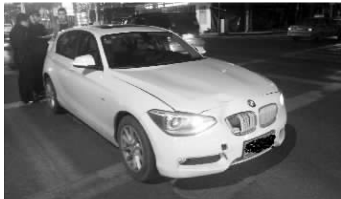
撞倒行人后，宝马车停在路中央

快报讯(记者 付瑞利)4月22日晚上11点40分左右，常府街与三条巷交叉路口处，一辆白色宝马车撞倒两个过马路的小伙子。小伙子称宝马车速度很快，很可能是在飙车。但宝马车司机否认，说两人突然跑向路中央，自己避让不及才撞上的。