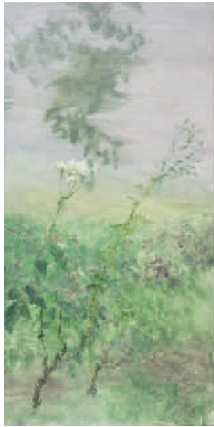
何多苓作品《杂花写生》